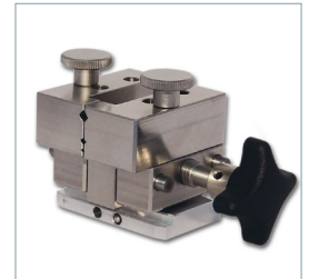
Eine Vielzahl an Musterhaltern ermöglicht die Bearbeitung vieler unterschiedlicher Crimpkontakte.