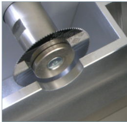
Langlebiges Hartmetallsägeblatt für präzise Schnitte (SPU 6 / SPU 6 Comfort).

Produktivität: Sägeblatt und Polierscheibe befinden sich auf einer Linie, weshalb der kombinierte Säge- und Polierprozess in nur einer einzigen Bewegung durchgeführt wird. Die Bearbeitungszeit wird dadurch minimiert.