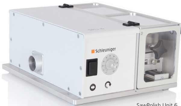
SawPolish Unit 6