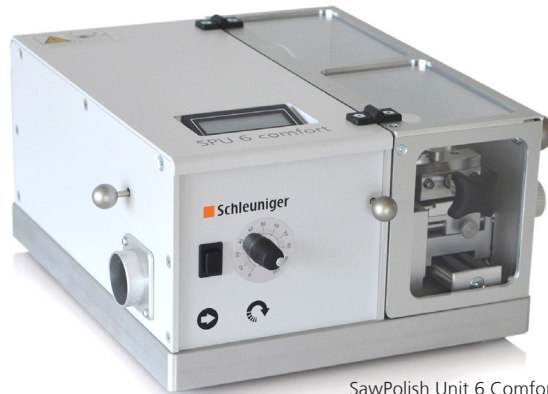
SawPolish Unit 6 Comfort