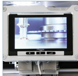
Digitale Lupe mit 4-, 6-, 8- und 11-fachem Zoom (SPU 6 Comfort / Optional).