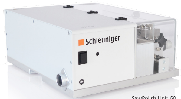
SawPolish Unit 60