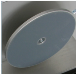
Polierscheibe für noch glattere und noch sauberere Oberflächen.